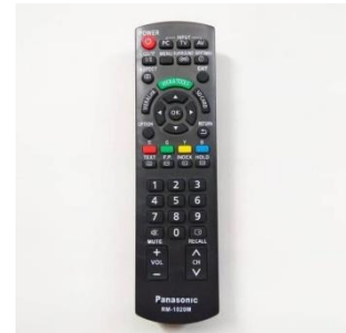
Gambar 3: Remote TV