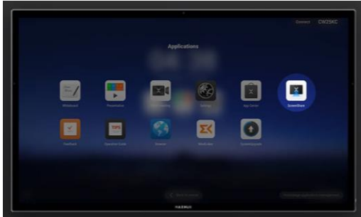
Gambar 1: Monitor