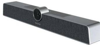
Gambar 2: MaxHUB Bar